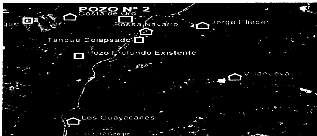
Fuente: Informe de Interventoría Nro. 113 de febrero de 2020 – Ilustración Nro. 3 Elaboró: Auditor

comunidades afectadas, mientras entra en pleno funcionamiento nuevamente el tanque.